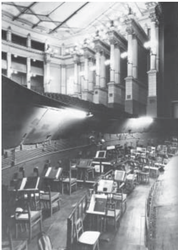
Näkymä orkesterisyvennyksen yläosasta katsomoon

Seuraavaksi pääsimme näyttämölle. Se on 32 metriä leveä, 25 metriä syvä – syvyyttä voidaan lisätä jopa 40 metriin takanäyttämön ( rear stage ) mukaan luki. Näyttämön katon rajaan asti korkeutta on 30 metriä. Neljä pyörörainaa ( cycloraina ) heijastavat taustafondefeja,