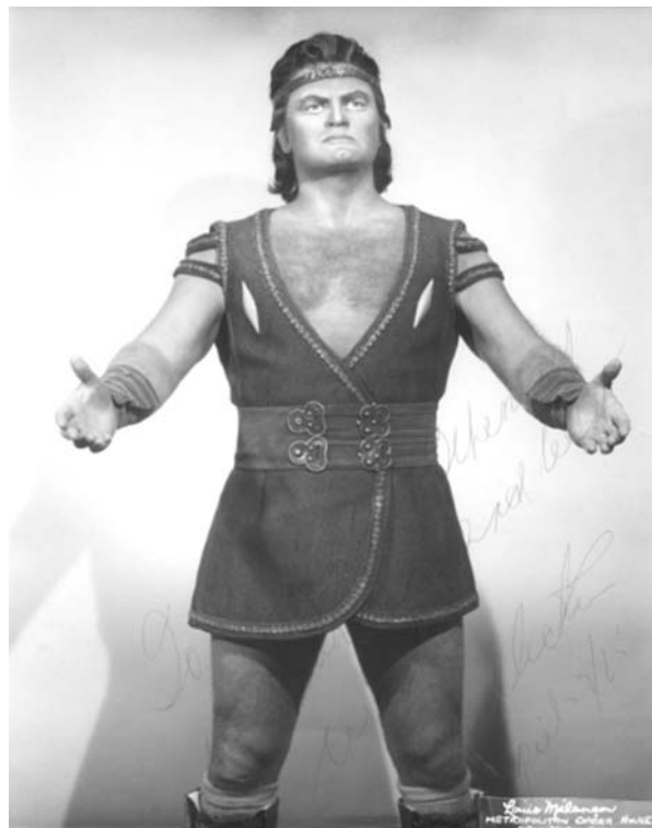
Myös Simson kuului Jon Vickersin suurimpiin rooleihin.

Moni pitää Sándor Kónyaa (16, 22, 26) maailman parhaana Lohengrinina. Hänellä on erittäin kaunis, hieman italialaistyypinen spinto-ääni, joka sopii myös Parsifaliin. Hänen Parsifalistaan tuntuu puuttuvan hänen Lohengrininsa