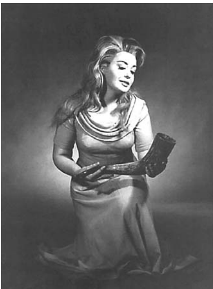
Gwyneth Jones Sieglindenä

Martha Mödlistä (4, 7, 9, 11-13) tuli 50-luvun Bayreuthissa Kundryn ruumiillistuma. Hänellä oli persoonallinen ääni,