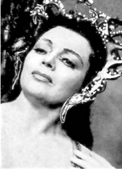
Martha Mödl, Kundryn ruumiillistuma

Parsifalin oudoin ja tavallaan kiehtovin rooli on Kundry. Hahmon tietynlainen skitsofreenisuus johtuu osittain siitä, että Wagner kokosi hänet useasta Wolfram von Eschenbachin Parzival -eepoksessa esiintyneestä henkilöstä. Erikoista on myös se, että Kundryn lähes koko lauluosuus on toisessa näytöksessä, vaikka hän käväisee näyttämöllä jo ensimmäisessä ja on lavalla koko kolmannen näytöksen ajan. Musiikillisesti rooli on ehkä tämän oopperan vaikein, atonaalisuutta lähenevää kromatiikkaa on paljon. Usein sopraanolle rooli on liian matala, mezzosopraanolle taas liian korkea. Monet parhaista Kundryista ovat jotain sopraanon ja mezzon väliä. Parsifalin kantaesityksessä kesällä 1882 Kundrya esitti sopraano Amalie Materna , seuraavassa esityksessä mezzosopraano Marianne Brandt .