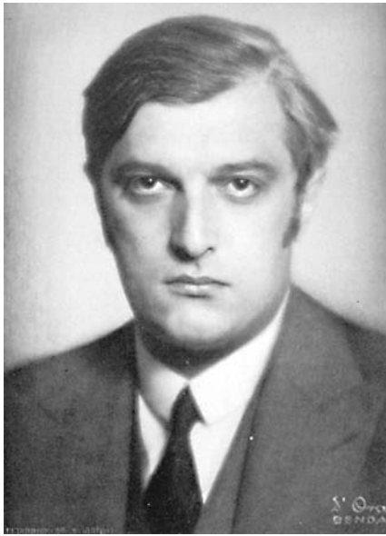
Clemens Krauss

Ääneltään melko epämääräisiä historiallisia äänitteitä ovat Fritz Buschin johtama esitys Buenos Airesin Teatro Colónista vuodelta 1936 (1) sekä vuonna 1938 Metropolitanissa taltioitu esitys (2), jossa ensimmäisen ja kolmannen näytöksen johtaa Artur Bodanzky ja