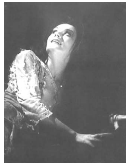
Waltraud Meier, oman aikamme suurin Kundry

1900-luvun kuuluisimmat Wagner-sopraanot Kirsten Flagstad (2), Astrid Varnay (10, 22) ja Birgit Nilsson eivät olleet Kundryn roolissa aivan omimmillaan. Nilsson ei esittänyt sitä oopperalavalla, ja levytti siitä vain osia. Flagstatilta on julkaistu koko rooli. Tavallaan hän laulaa sen useasti, mutta silti on selvää, että Brünnhilden ja Isolden kaltaiset roolit sopivat hänelle paremmin. Varnay onnistui häntä paremmin. En varsinaisesti pidä hänen ääntään mitenkään kauniina, mutta Kundryn rooliin se sopii. Hän pystyy hienosti esittämään hahmon kaikki tunnetilat ja kuulostamaan välillä pelottavalta, välillä viettelevältä. Vuonna 1966 hän ei ollut enää aivan parhaimmillaan, ja ääni kuulostaa joissakin kohdissa kirkuvalta.