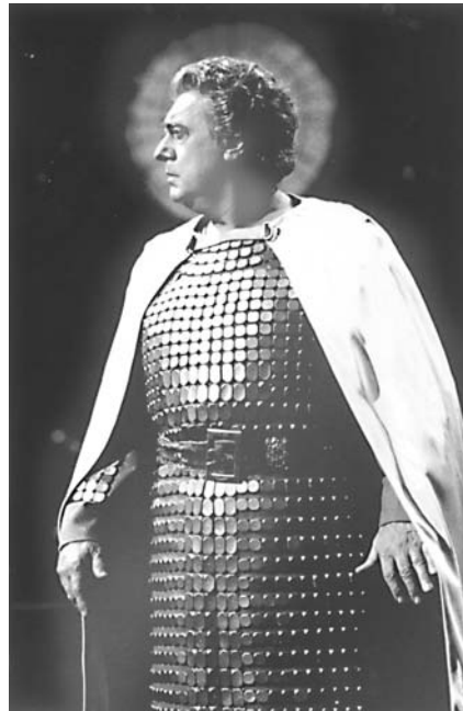
Placido Domingo Parsifalina Bayreuthissa.

Jess Thomas (19) tunnetaan Karajanin katastrofaalisena Siegfriedinä, mutta Parsifalin kaltaiset roolit sujuivat häneltä