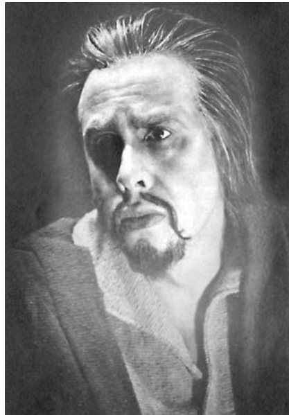
George London, ahdistunein Amfortas (Kuwa: Bayreuth 1951)

Amfortasin osuus rajoittuu lähes pelkästään kahteen monologiin. Nämä monologit ovat erittäin dramaattista sturm und drang -henkistä tuskanhuutoa, joten helppoa laulettavaa ne eivät ole. Vaikeutta lisää se, että rooli pitää esittää maukuasennossa.