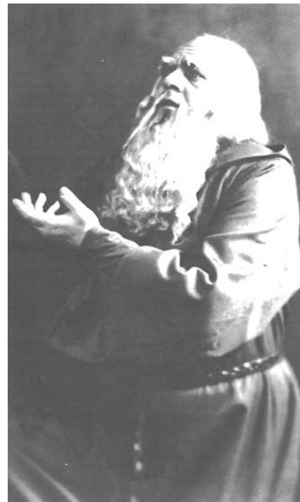
Alexander Kipnis oli sotienvälisen ajan suurin Gurnemanz

Donald McIntyre (35) on ainoa laulaja, joka on levyttänyt sekä Gurneman-