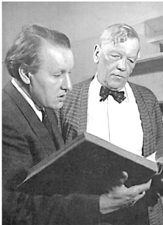
Ohjaaja Wieland Wagner ja kapellimestari Hans Knappertsbusch, joiden yhteisistä Parsifal -esityksistä peräti yhdeksän on julkaistu levyllä.

Näiden Boulezin esitysten välillä Parsifalia on Bayreuthissa johtanut sekalainen joukko kapellimestareita. Videolla julkaistu Horst Steinin rutiininomaisesti johtama esitys (32) on mitänsanomattomimpia kautta aikojen. Esityksen ohjasi