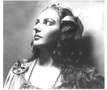
Nuori Maria Callas Isoldena