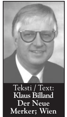
Teksti / Text: Klaus Billand Der Neue Merker; Wien

Reininkullan alussa näimme Reinin pohjassa vanhojen kulttuurien reliikkejä kuten pat-saita ja pylväitä. Jumalten tuhon