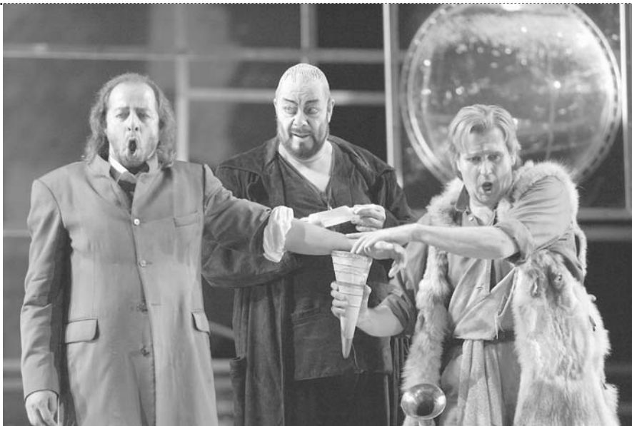
John Treleavenin laulaminen ja näytteleminen oli ilmiömäistä.

Nina Stemme as Sieglinde, John Treleaven as Siegfried, Matti Salminen as Hunding and Hagen and Juha Uusitalo as Wotan/Wanderer were the main pillars of this Finnish Ring . Nina Stemme has become a first class Sieglinde. She masters the part completely and brings warmth to her role. Her farewell to the dead brother was very emotional. One can easily predict that she has a great career in front of her. John Treleaven's singing and acting was extraordinary, both in Siegfried and in Götterdämmerung . His voice sounds really golden at the top. His reserves seemed inexhaustible at the end of Siegfried, and surely nobody can do the high C at the Rheinufer in Götterdämmerung like he does it. Very lyrically and with excellent legato he took "Selige Öde auf sonniger Höh". This, coupled with his charismatic acting and handsome appearance make him a congenial and credible Siegfried. Matti Salminen has obviously become a national hero on the Finnish operatic stage. His aplomb coupled with the power of his voice which he lent to the incarnation of Hunding and Hagen won him