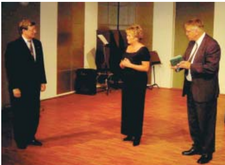
Juhliva seura sai onnitteluja mm. Lahden Aplodit orkesterille -yhdistykseltä.