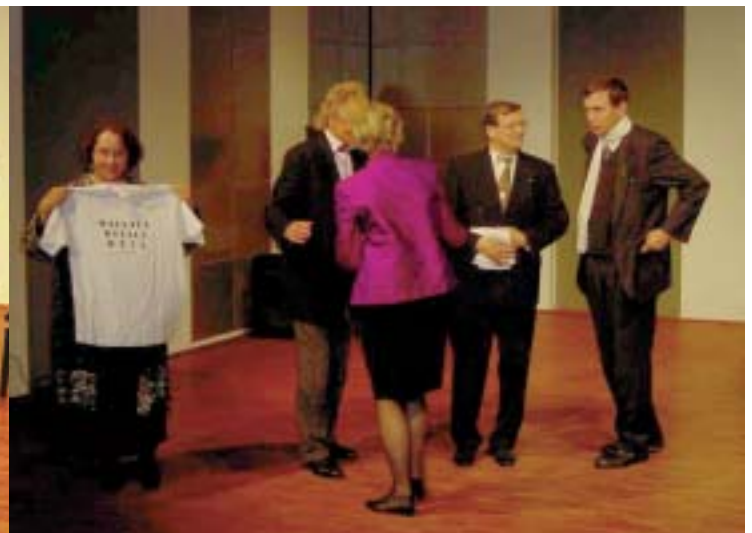
Juhatoimikunta huomionsoitusten kohteena