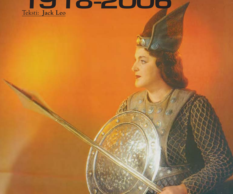
Birgit Nilsson, yksi kaikkien aikojen suurimmista Wagner-laulajista, Brünnhildenä Wienissä vuonna 1957.

1900-luvun loppupuoliskon epäilemättä suurin Wagner-sopraano, ruotsalainen Birgit Nilsson , kuoli joulupäivänä 87-vuotiaana.